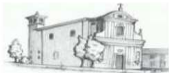
San Prospero Strinati